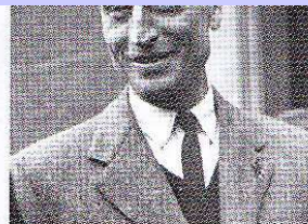
Emmanuel d'Astier de la Vigerie

Emmanuel d'Astier de la Vigerie, Rapport AX.O3, « Organisation générale des secteurs », 12 octobre 1942.